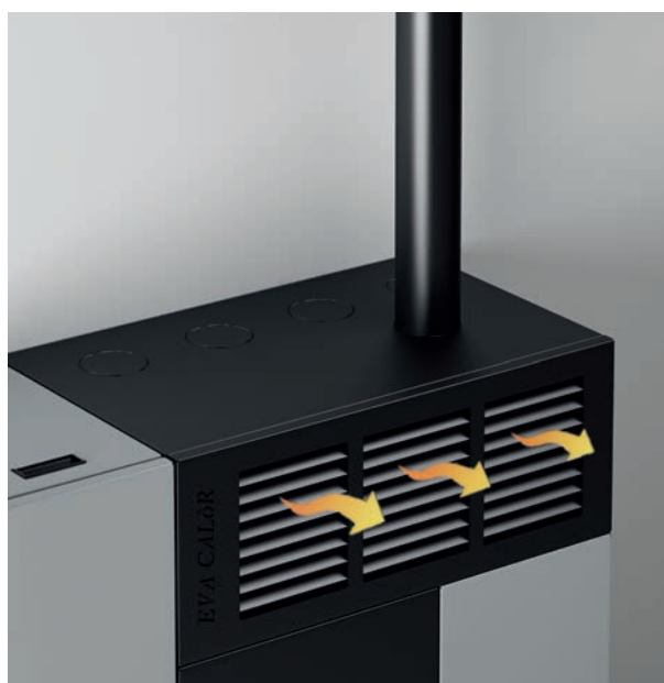
Salida de aire frontal