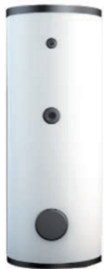
Acumulador Integrado de 120L.