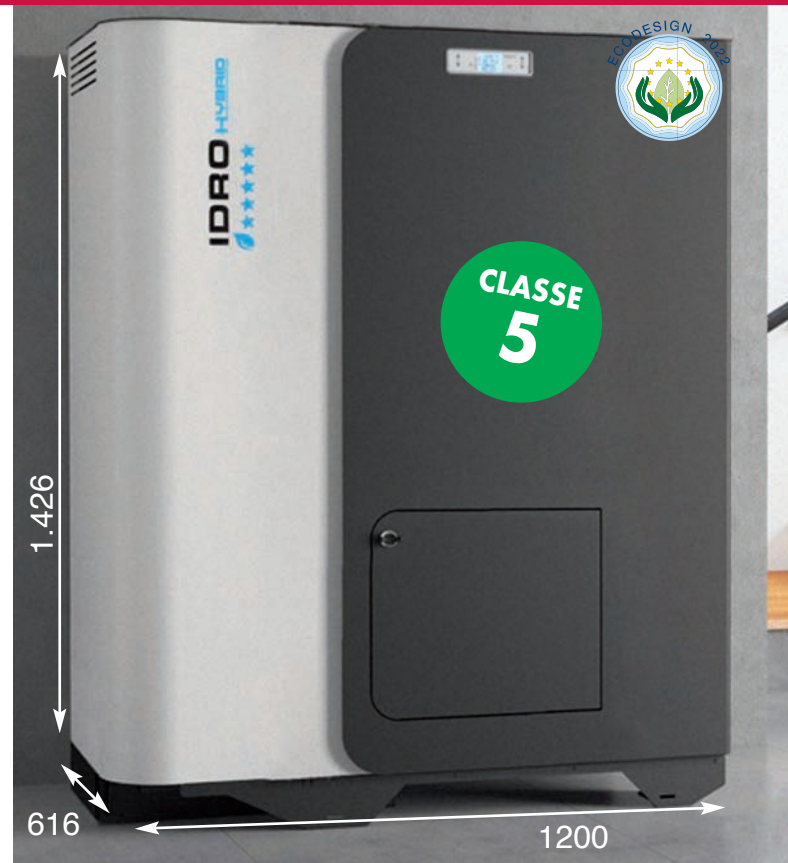
Sistema Oslo Domus combinado con acumulador ACS interno (120L)