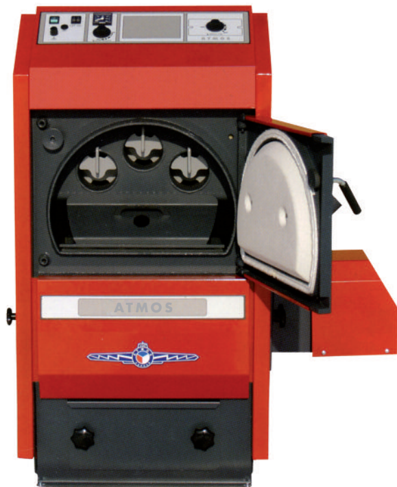
Interior Cámara de Combustión