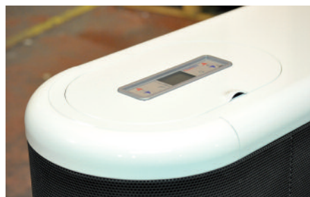
Fondo 29 cmts.