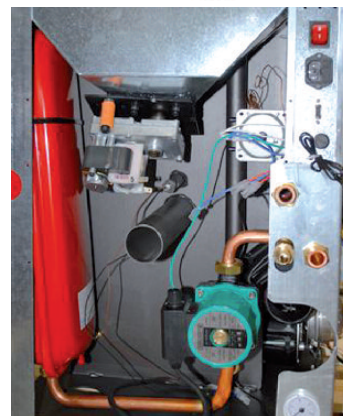
Interior termoestufa con sus componentes