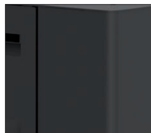
PROFUNDIDAD 25 CM.